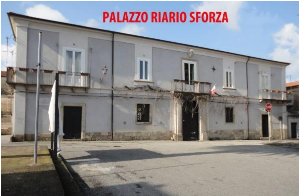
Polistena: Piazza del Popolo

La Società Agricola Riario Sforza s.s. si estende su un vasto territorio di circa 1000 ettari, ricadente nei Comuni di Galatro, Polistena, Melicucco e San Giorgio Morgeto. Primeggiano gli uliveti delle Contrade Vittoria, Bellagio e Castellace; i Kiweti di Pordenza, Vittoria e Villa intervallati da agrumeti (principalmente arance e mandarini), e le fitte e verdeggianti montagne che tracciano il confine tra l'Aspromonte e le Serre.