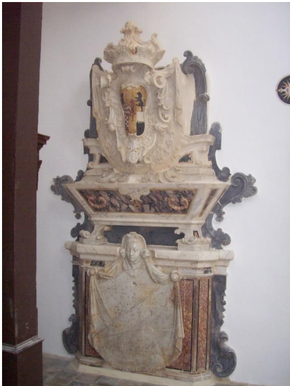
Sepolcro di Giovanni Domenico Milano, principe di Ardore.