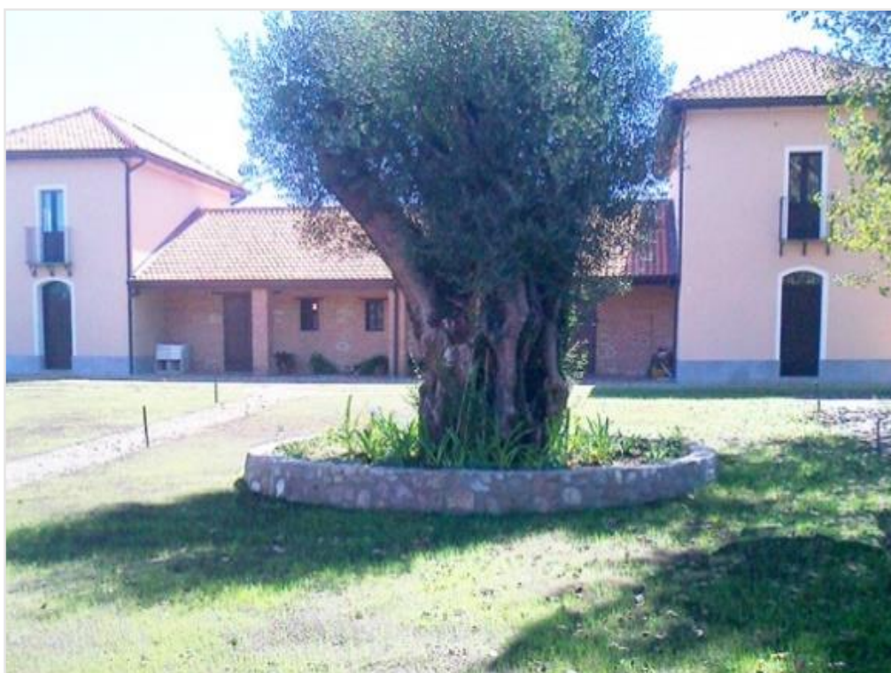
AGRITURISMO E RIFUGIO MONTANO

L'Agriturismo e il Rifugio di montagna di Contrada Castellace, nel comune di Galatro, sorgono in una delle zone più paesaggistiche della Calabria, sui Piani di Prateria e a ridosso dei folti boschi dell'Aspromonte e delle Serre. Offrono alloggio in camere caratteristiche ricavate all'interno di due antichi torrioni collegati con un vasto salone ricettivo, luogo di incontro e preparazione per escursionisti e cacciatori, ma anche per gli amanti della tranquillità e del benefico ristoro offerto dalla natura.